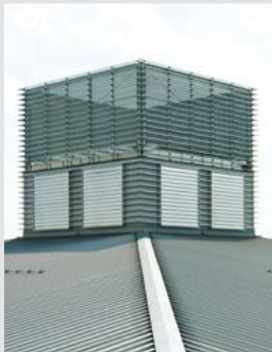
Lüftungsjalousie Typ FCO

Mit der „MesseWienNeu“ verfügt Wien ab sofort über eines der weltweit modernsten Messe- und Kongress-Zentren der Welt. Auf fast 70.000 Quadratmetern können über 6.000 Aussteller mit jeweils rund 25.000 Mitarbeitern von geschätzt 800.000 Besuchern jährlich besucht und auch öffentlich leicht erreicht werden.